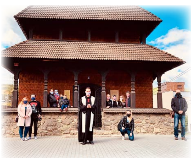
Májová „výzdoba“ na ulici kolem kostela v Blansku.